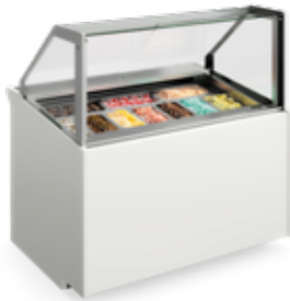
Vitrinas para gelados Ice cream display cases