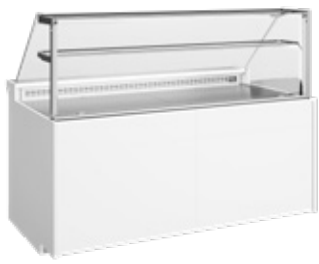
Vitrinas Display cases