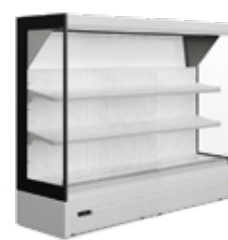
Frutas & Legumes Fresh Produce