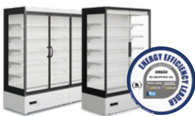
Alimentos refrigerados Chilled foods Portas convencionais / Portas Full Vision Conventional glass doors / Full Vision glass doors