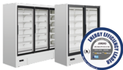
Alimentos congelados Frozen foods Portas convencionais / Portas Full Vision Conventional glass doors / Full Vision glass doors