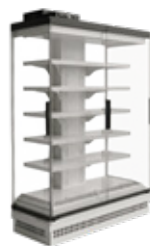
Topo panorâmico Panoramic top-of-aisle