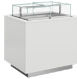
IMINS - VDB UV Ilha Island