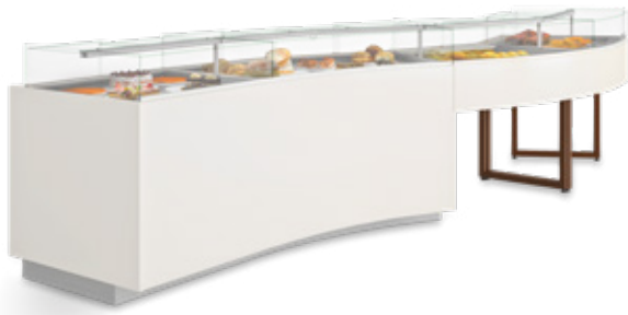
Vitrinas Display cases