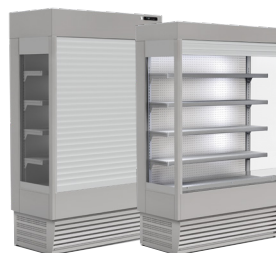
refrigerado com estore de segurança elétrico ou manual refrigerated with electric or manual security shutters