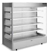
refrigerado sem base refrigerated without base