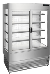
refrigerado com portas frontais (opcionais) refrigerated with front doors (optional)