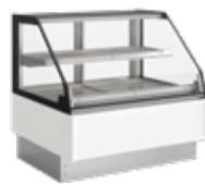
Grab & Go c/ portas de serviço w/ rear service doors