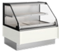
Grab & Go