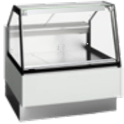
Vitrina Serve-over counters