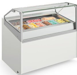
Vitruvas gelados Ice cream counters