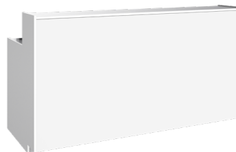
Balcões Bar counters